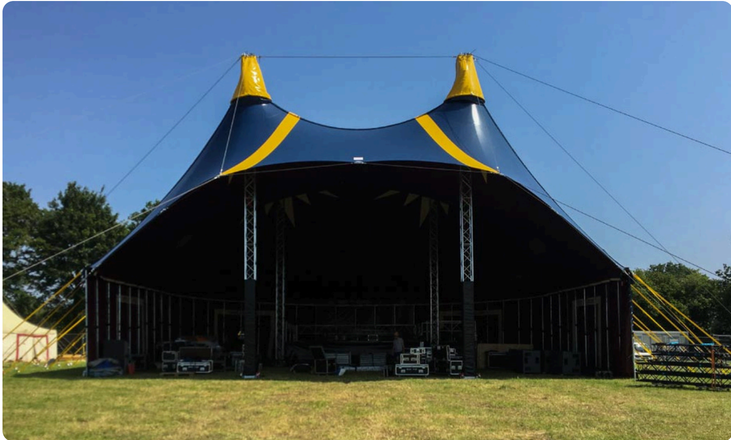
Kahut Palace - Chapiteau et scène

Installation d'un chapiteau d'une capacité de 2000 personnes pour accueillir les concerts du samedi et le repas champêtre du dimanche.