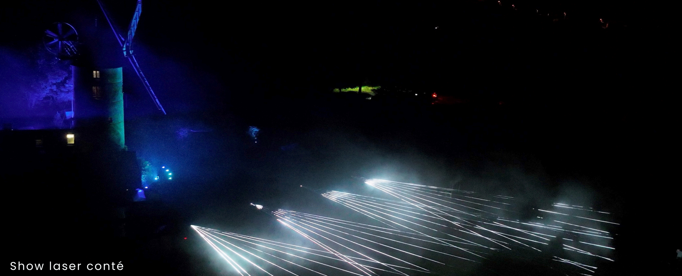
Show laser conté