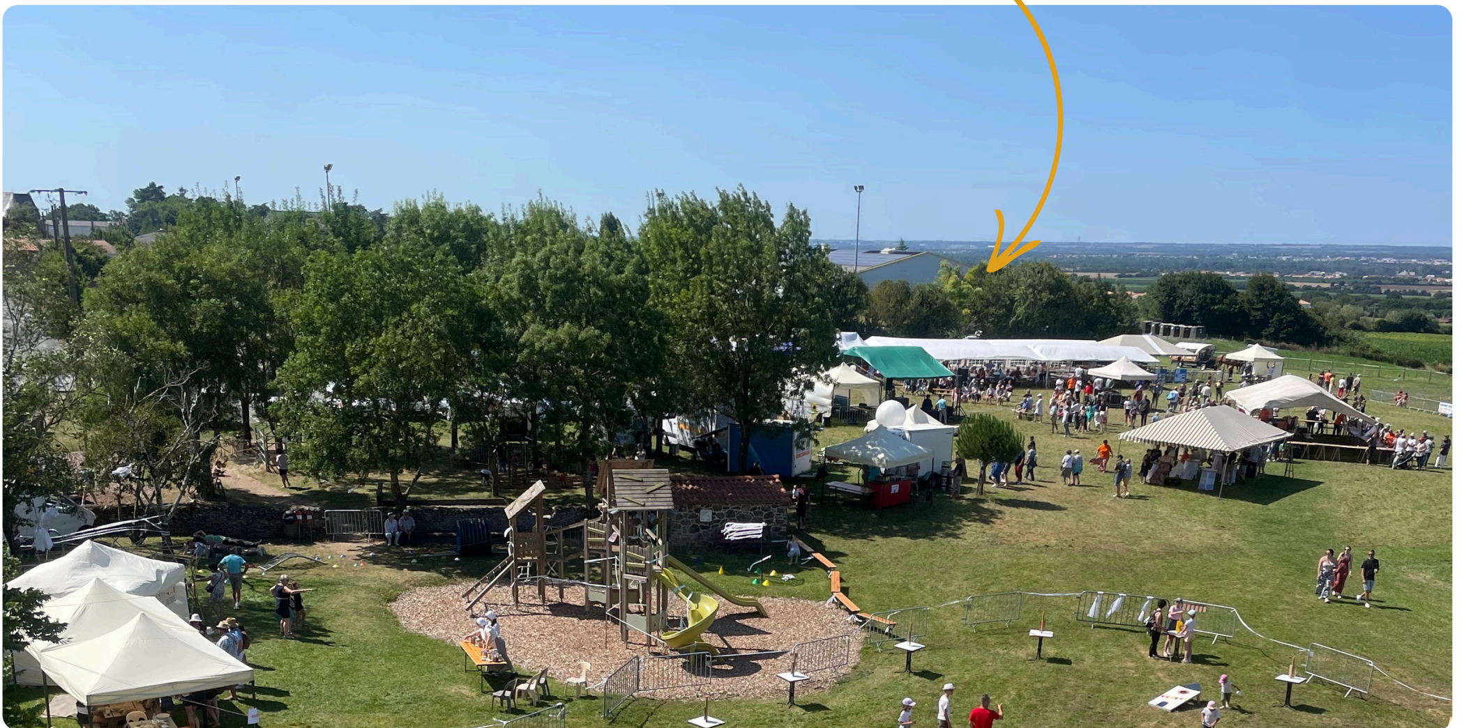
Esplanade des Estivales du moulin - Dimanche 28 juillet 2024